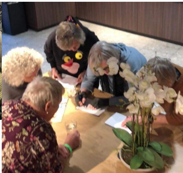
Resultatene sammenliknes: Han vi vunnet??