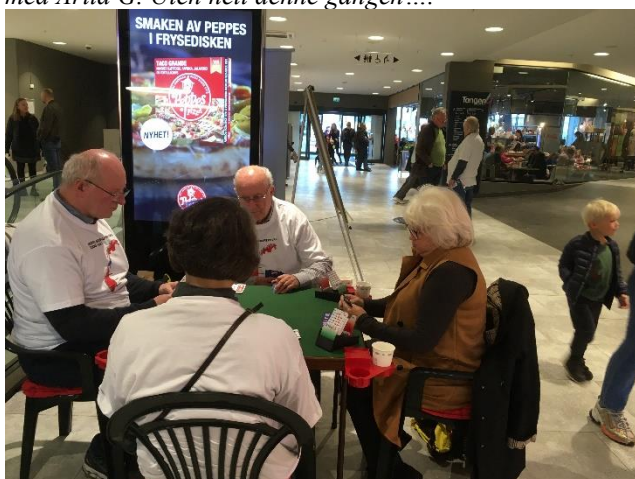
På stand i 2021 – da hadde vi bridgebord som var godt besøkt av folk på senteret