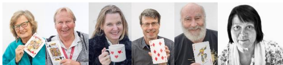
STYRET I NESODDEN BRIDGEKLUBB 2019-2020