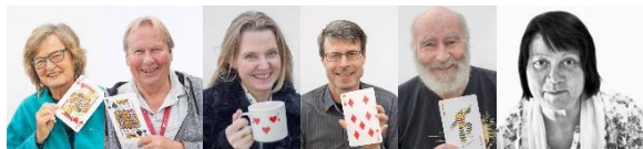
STYRET I NESODDEN BRIDGEKLUBB 2019-2020